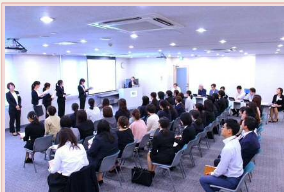
3期生による役員への活動成果報告

3期生においては、女性社員の働く環境の向上・女性社員の横のつながりの強化をテーマとし、4つのチーム編成で、1年間のタスク活動を実施しました。